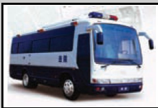
Xe van chết chóc