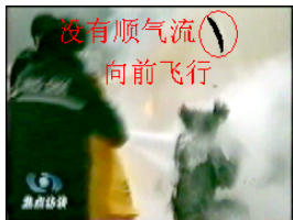
没有顺气流 向前飞行 Vật thể này bay ngược chiều với đám sương mù, bay nhanh về phía cảnh sát cứu hoả. Như vậy, nó không phải do phun sương mù cứu hoả gây nên.