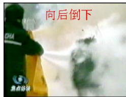
向后倒下 Cô Lưu gục ngã xuống. Đám sương mù cứu hoả che khuất người đánh.