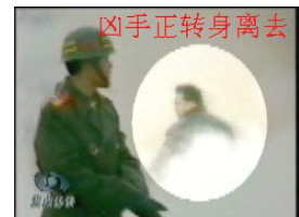
落到警察堆里 凶手正转身离去 Lúc ấy sương mù bắt đầu vãn đi. Trên màn ảnh xuất hiện một người mặc vũ trang cảnh sát tại đúng vị trí người đã vung tay đánh cô Lưu. Đó là ai? Anh ta quan sát cô ngã xuống, xong mới xoay người rời đi.

Những hình ảnh liên quan đến cái gọi là “vụ tự thiêu” đều lấy từ tư liệu của Tân Hoa Xã và Truyền hình Trung ương Trung Quốc.