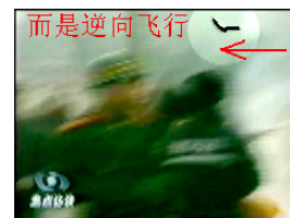
而是逆向飞行 Tốc độ bay nhanh cho thấy rằng đó là một vật nặng. Nó từ đâu? Lẽ nào từ áo, hoặc tóc của cô Lưu? Phải chăng là từ khí cụ đánh cô?