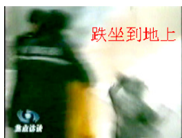
跌坐到地上 Cô Lưu ngã ngồi, trên người không có lửa. Tại sao cảnh sát phải phun ga cứu hoả? Để cô nghẹt thở? Hay để hung thủ ta tay? Vật thể kia bay tiếp về phía cảnh sát cứu hoả.