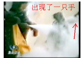
出现了一只手 ↑ Lúc ấy, xuất hiện một bàn tay ở phía sau cô Lưu.