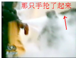
那只手抡了起来 ↑ Đột nhiên cánh tay đó đánh vào đầu cô Lưu từ phía sau.