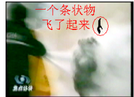
一个条状物 飞了起来 Nhin kỹ, một vật thể văng từ phía đầu cô Lưu bay ra phía trước