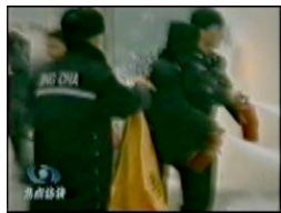
Cảnh sát đến cứu hoả.