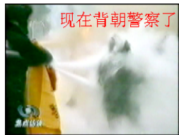
现在背朝警察了 Cô Lưu bị đánh, quay người lại, lưng hướng về phía bình cứu hoả.