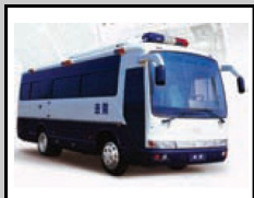
Xe van chết chóc